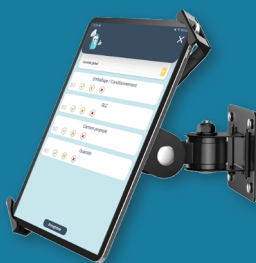
Station murale rotative et sécurisée antivol*