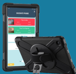
Etui anti-choc + bandoulière amovible et réglable*