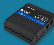
Connectivité - Hub 4G*